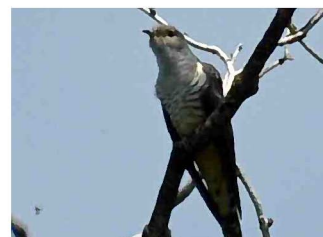
a ト ト _ ^